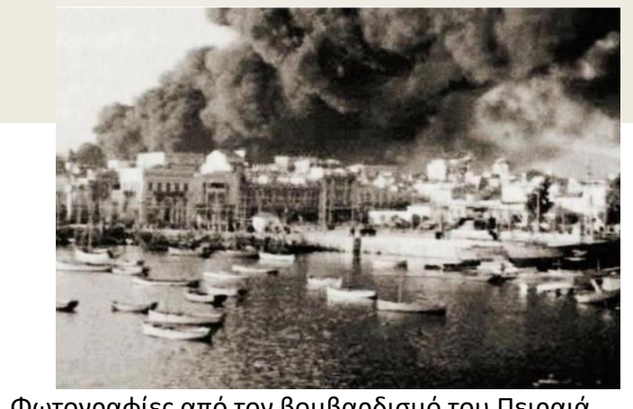
Φωτογραφίες από τον βομβαρδισμό του Πειραιά