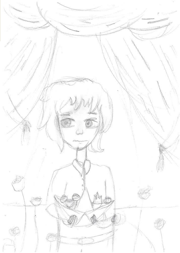
ΖΩΓΡΑΦΙΑ ΑΠΟ ΤΗΝ ΌΛΙΑ ΛΕΠΕΣΗ